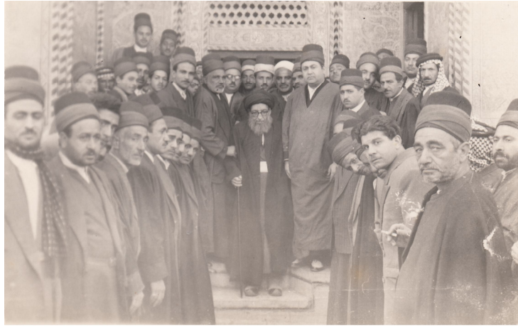
التقطت هذه الصورة الرائعة في الروضة العباسية المقدّسة

يعتقدون أنّ أيّ إضعاف يصيبه من جانبهم هو إضعاف للمركزية الدينية والزعامة الإسلامية وإذا ما أصيبت الزعامة الإسلامية بضعف - لا سمح الله - فإنه سيّشمل كافة العلماء الأعلام - مراجع التقليد - وإنّ إهانة العلماء هي إهانة للأمة وهل نبقى للأمة الإسلامية قيمة أو كرامة إذا أهين قادتها الروحيون أو تعرضوا لعدوان أثيم أو خطر جسيم؟ فكيف وهم المصابيح التي تنير الطريق بنور الإسلام الذي قال تعالى: ﴿يُرِيدُونَ لِيُطْفِئُوا نُورَ اللَّهِ بِأَفْوَاهِهِمْ وَاللَّهُ مُتِمُّ نُورِهِ وَلَوْ كَرِهَ الْكَافِرُونَ﴾. وتمثل هذه الصورة التاريخية الخالدة جانباً من تلك المواقف الرائعة للسادّة خدمة الروضتين.